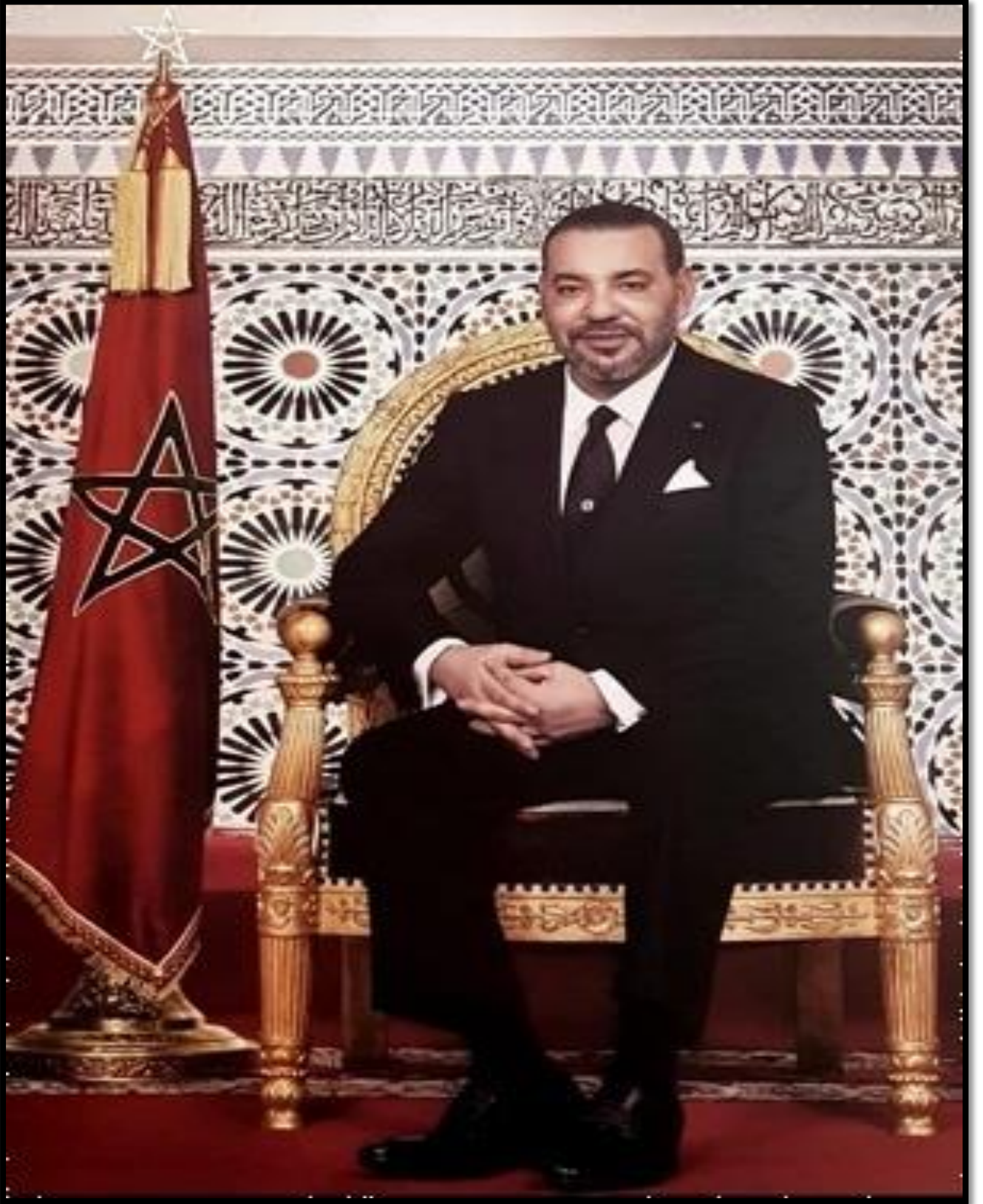
صاحب الجلالة الملك محمد السادس نصره الله وأيده